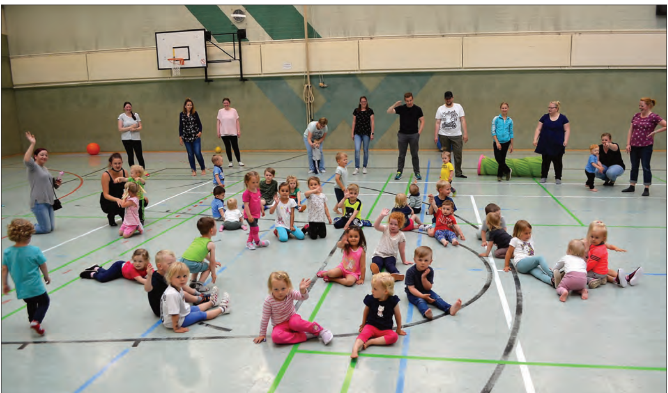
In der Mitte versammelt, warten die Turnzwerge auf den Beginn des Abschlusskreises.

Neuenwalde Holßeler Weg 1 27607 Geestland Tel. (04707) 930 100 Mobil 0176-99 39 78 51