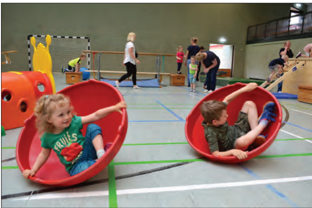
Ob als Karussell oder als Schildkrötenpanzer – die Kreisel werden stets kreativ eingesetzt.

Die enorme Resonanz auf unseren Neustart zeigte deutlich: Der Bedarf an sportlichen Angeboten für den Neuenwalder Nachwuchs ist riesig. Am Eröffnungstag begrüßten wir knapp 40 Kinder mit ihren Begleitungen und sogar die tropischen Temperaturen am letzten Montag im Juni hielten nur wenige davon ab, in die aufgeheizte Sporthalle zu kommen, um sich gemeinsam zu bewegen und Spaß zu haben.